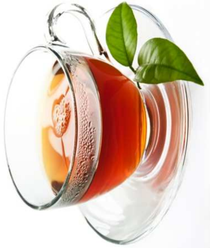
HERBATA (1 filiżanka / torebka)