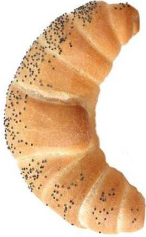
ROGALIK (1 sztuka)