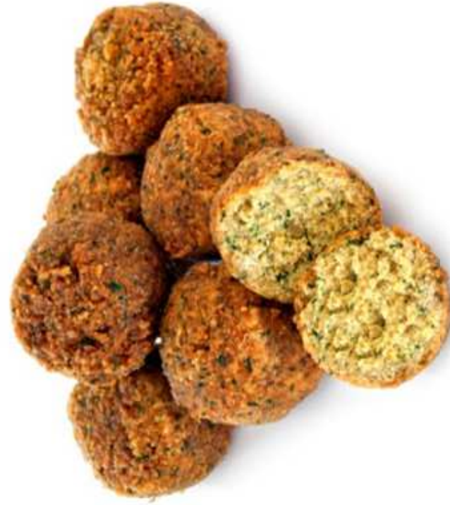
FALAFEL (1 sztuka)