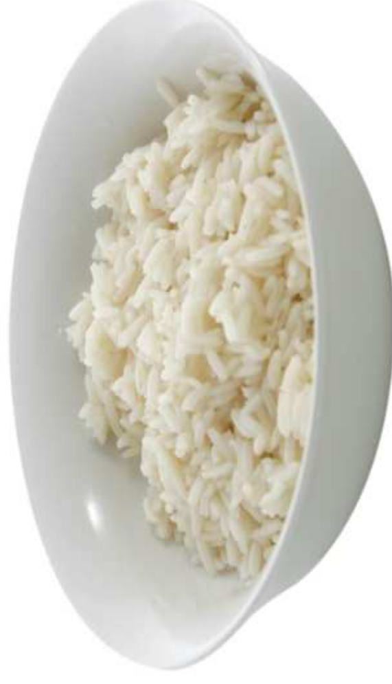
RYŻ (1 porcja)