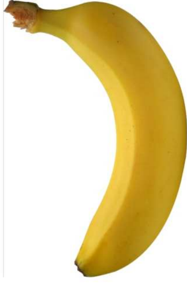
BANAN (1 sztuka)