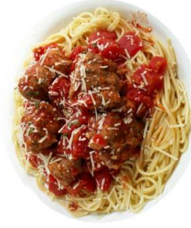
MAKARON Z MIĘSEM (1 porcja)