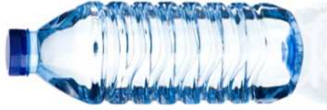
WODA BUTELKOWANA (1 litr)