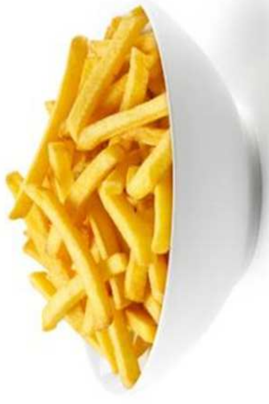
FRYTKI (1 porcja)