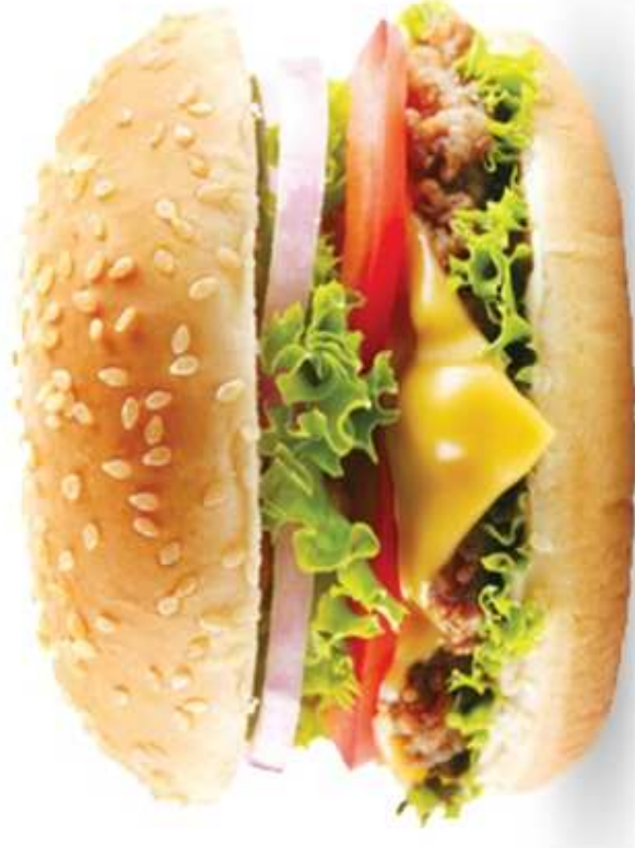
HAMBURGER (1 sztuka)