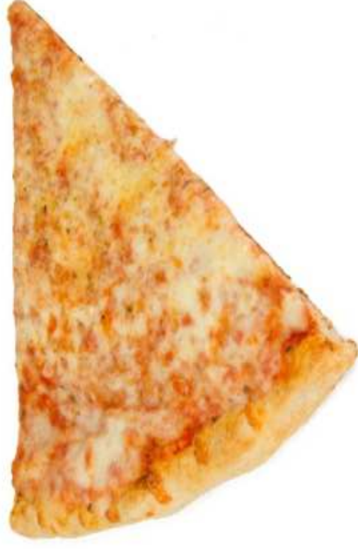
PIZZA Z SEREM (1 kawałek)