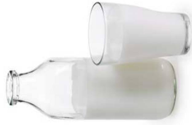
MLEKO KROWIE (1 szklanka)