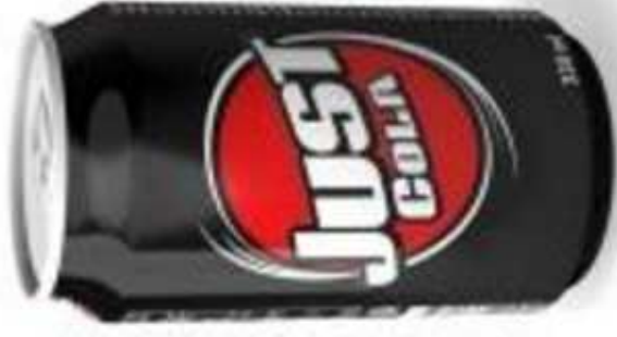
NAPÓJ GAZOWANY (1 puszka)