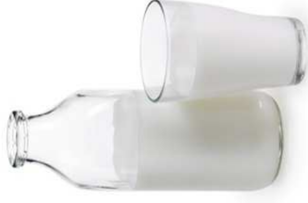
MLEKO SOJOWE (1 szklanka)