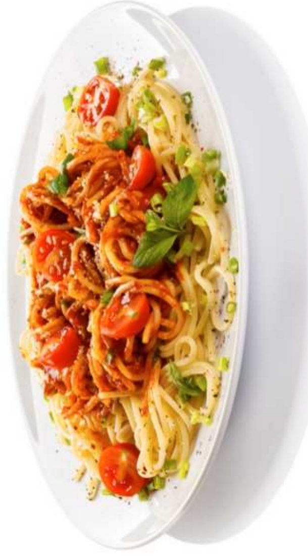
MAKARON Z SOSEM POMIDOROWYM