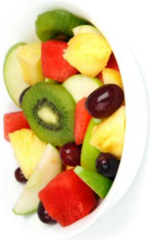
SAŁATKA OWOCOWA (1 porcja)