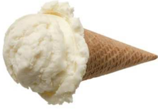
LODY ŚMIETANKOWE (1 porcja)