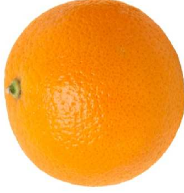
POMARAŃCZA (1 sztuka)