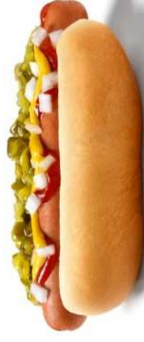
HOT-DOG (1 sztuka)