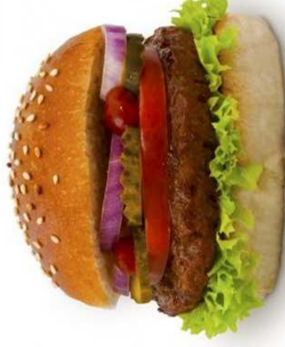
TOFU BURGER (1 sztuka)