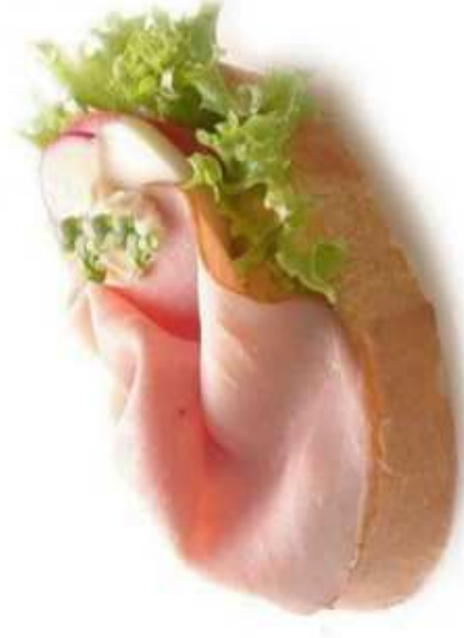
KANAPKA Z WĘDLINĄ (1 sztuka)