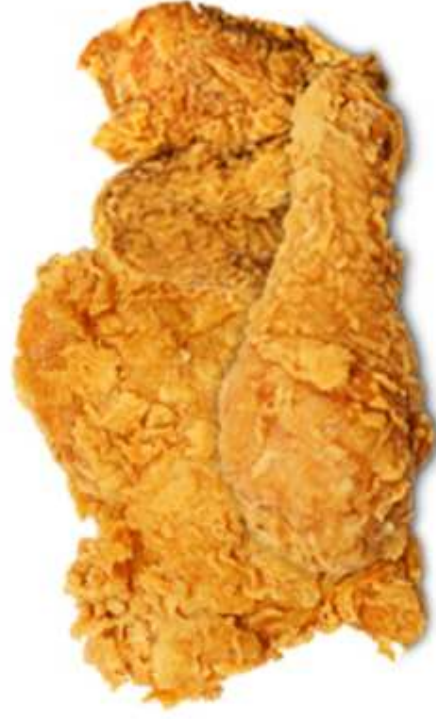
KOTLET DROBIOWY (1 sztuka)