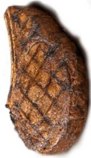
STEK WOŁOWY (1 sztuka)